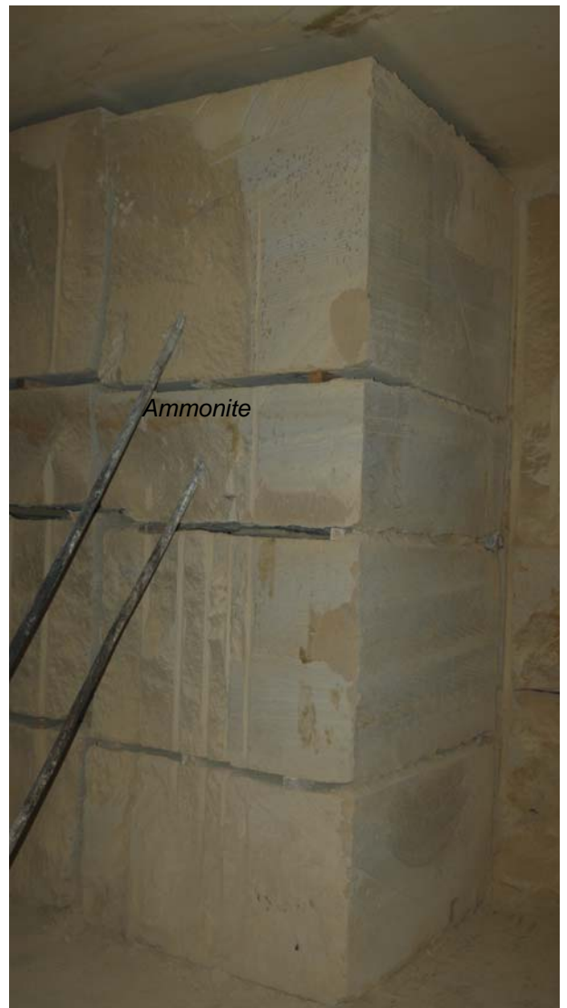
Découpes dans le Calcaire de Caen