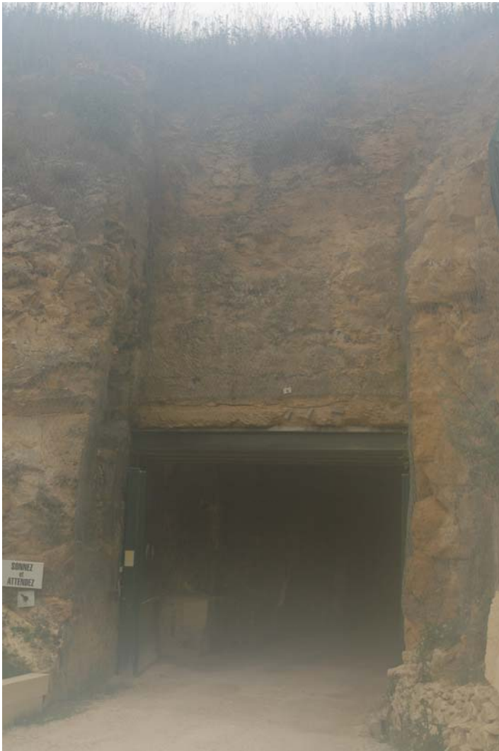
Entrée de la carrière souterraine