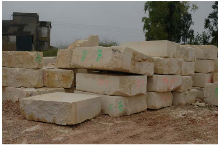
Blocs dans la Pierre de Caen