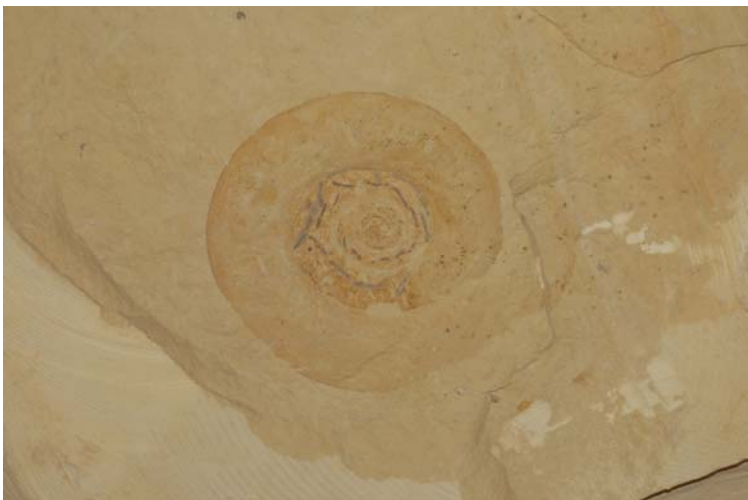
Ammonite au toit de la carrière